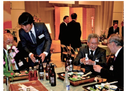
過去最多の出席者であふれんばかりの会場。 1年を笑顔でスタート。良い年になりますように！ 会員同士の交流が深まりました。