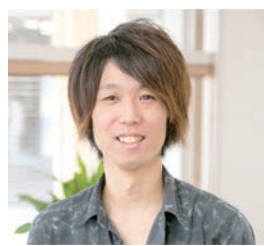
最高の癒しを提供します

ジナルのゲームも含め約140種類を用意しています。私は東京での大学時代にボードゲームの面白さに魅了され「ボードゲームを活かし、人が集まる場所を提供して地域の役に立つ仕事になりたい」と考えるようになった。その後、起業に向けて準備を進め、祖父のいるこの加茂で昨年10月にオープンしました。地元元のゲーム愛好家や小学生からお年寄りまで幅広くご利用いただいています。店内はテーブル席と椅子席があり、ワッフル等の軽