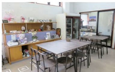
お気軽に遊びに来てください

食も用意しています。利用料金は、平日は時間制限なしで500円、土日、祝日が最長4時間で大人1千円、子供500円、他に月額プランもあります。毎月第4水曜日は無料開放日ですので、ぜひご利用ください。