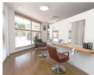
明るく落ち着いた店内

ムを使っています。シャンプーブースは落ち着いた雰囲気個室となっていて、周りを気にせずリラックスできると思います。その日の気分や時間帯などによって使用するアロマを変えているので、こちらも楽しんでください。美しい髪のため、また、育毛、アンチエイジング、リ