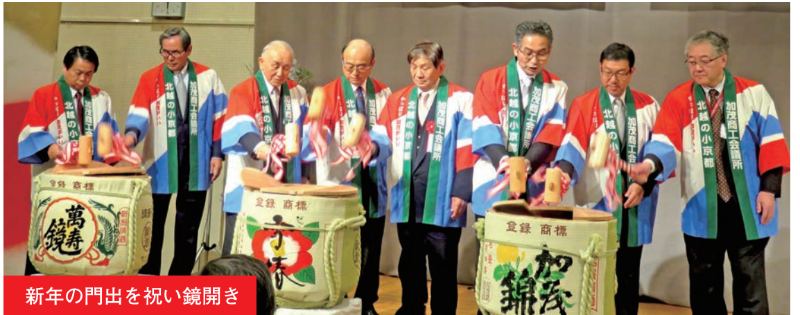
新年の門出を祝い鏡開き