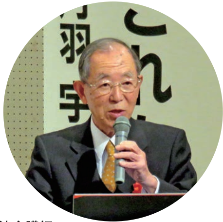
新春講演会講師 (公社) 日本中国友好協会会長 丹羽宇一郎氏