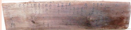
新発田藩からの通知が書かれている高札 / 加茂市民俗資料館所蔵