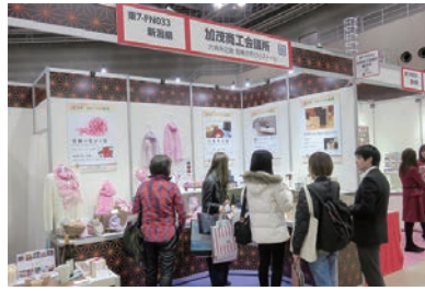
昨年の出展の様子

当商工会議所では、東京ビッグサイト(東京都江東区)に於いて2月12日(火)から15日(金)に開催される「インターナショナルギフト・ショー(FEEL NIPPON)」に出展いたします。雪椿の花びら染のストールやハンカチ、六角形の升「六角升之助」の他、木工製品等を出品し、新規顧客獲得と販路拡大を目指すとともに、加茂の技や特産品を全国に向けてPRしてまいります。