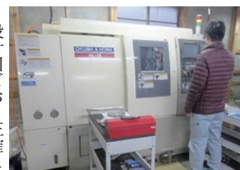
お客様が求める価格・納期に精一杯お応えします!

【住所】 加茂市寿町17-19 【TEL】 080-1134-0072 【営業時間】 8:00~17:00 【定休日】 不定休